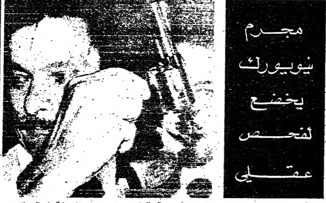
أحد رجال البوليس يعرض مسمى «ابن ساءم» على الصحافيين